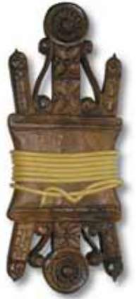
“アルギサイオラ(死者へ手向ける渦巻き型ろうそく)は、バスク伝統文化の一つで、今でもギブスコア県の田舎で受け継がれています。

ギブスコアの東側は、ビダソア-チングディ地域から始まります。フランスとの国境沿いに位置しているその町々は、さまざまに揺れた歴史をもち、今日でも、その時代の軍隊を模したパレード“アラルデ”