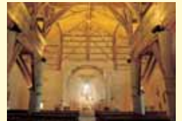
唯一 ラアンティグアの屋根を支える木製の枠組。幼子イエスを抱く聖母の姿は“もっとも大きいバスク礼拝堂”の、もう一つの魅力です。