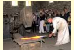
白熱 レガスピのミランダオラの鍛冶場で造られる鉄。一つの水車で動く古い設備を使って、昔の製鉄法を実際に見せてくれます。