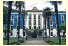
リラックス ベルエボック時代に流行になった鉱泉水で知られるセストアの温泉。今日では、古い豪華な建築に新しい設備が加えられています。