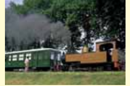
鉄道 ウロラの旧アスペイティア駅にある鉄道博物館では、実際に蒸気機関車に乗ることができます。