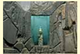
縮小 アランサスのよく知られたマリア像の大きさは、わずか36センチ。しかしながらルシオ・ムニョス作の木製の祭壇に囲まれて際立って見えます。