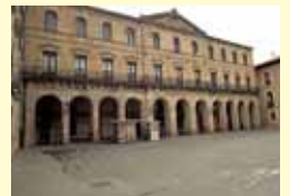
科学的 レアルセミニリオ・デ・ベルガラは、18世紀科学界での基準でした。エルウヤール兄弟は、そこでタンクステンを発見しました。